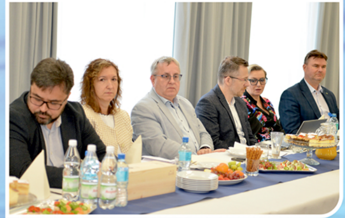
Liczenie przybyli na Walne Zgromadzenie NSZZ Pracowników ArcelorMittal Poland delegaci. W drugiej części zabrania uczestniczyli zaproszeni goście: szefowie central związkowych, prezesi, dyrektorzy, menedżerowie spółek hutniczych i ArcelorMittal Poland.