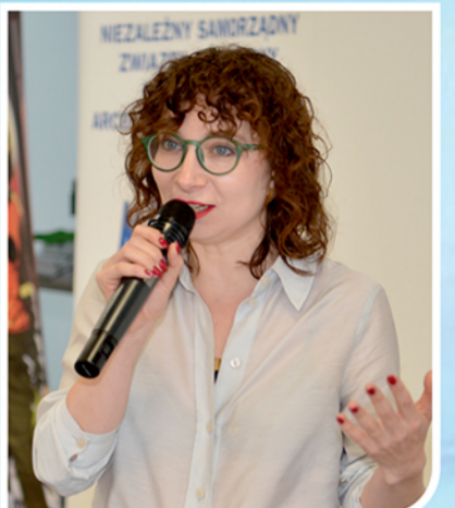
Posłanka KKP Lewicy Daria Gosek-Popiołek.

Posłanka Daria Gosek-Popiołek podkreśliła, że spotkanie ze stroną związkową stanowi istotne źródło wiedzy o problemach pracowników i wyzwaniach rynku pracy. Zaznaczyła, że kwestie pracy, dialogu społecznego oraz praw pracowniczych pozostają dla